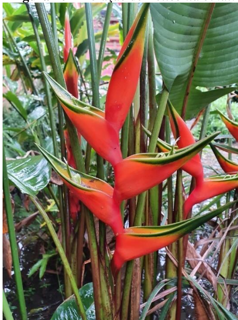
Figura 10 - Floração de Heliconia bihai .

A forma de propagação se dá pelo plantio de rizomas, por micropropagação ou por sementes, dependendo da espécie. As espécies mais cultivadas são: Heliconia bihai (Figura 10), H. psittacorum (Figura 11), H. rostrata (Figura 12).