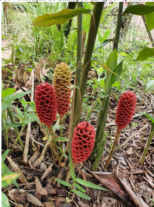
Figura 07 - Floração do Shampoo ( Zingiber spectabile Griff.).

O Shampoo é cultivado em climas tropicais e subtropicais, seu porte varia conforme o ambiente em que se encontra, essa espécie é considerada perene, suas florações são belas (Figura 7), e atraem olhares dos consumidores.