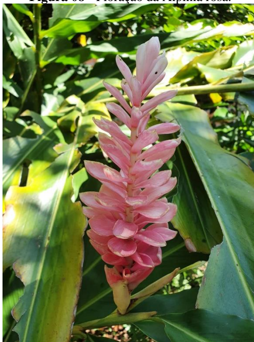
Figura 08 - Floração da Alpínia rosa.

A coloração das brácteas varia, podendo ser rosa (Figura 8) ou vermelha (figura 9), as alpínias apresentam diversas variedades sendo elas a variedade pink , jungle king (figura10) e a red , ambas são comercializadas no mercado de flores de corte e todas apresentam grande aceitabilidade.