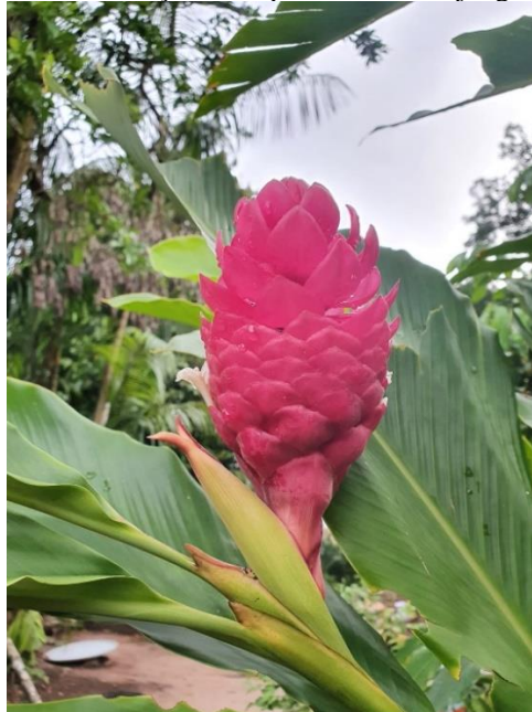
Figura 09 - Floração da Alpínia variedade jungle king.