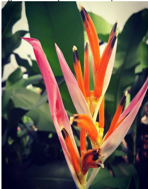
Figura 11 - Floração de Heliconia psittacorum .