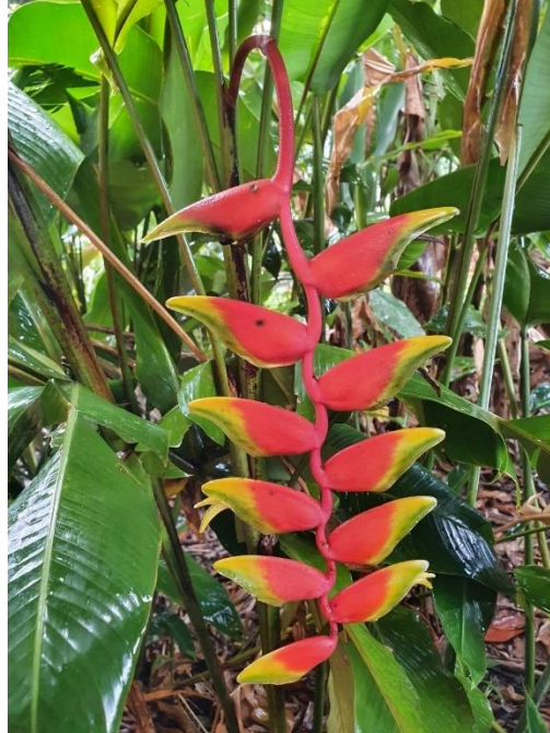
Figura 12 - Floração de Heliconia rostrata .