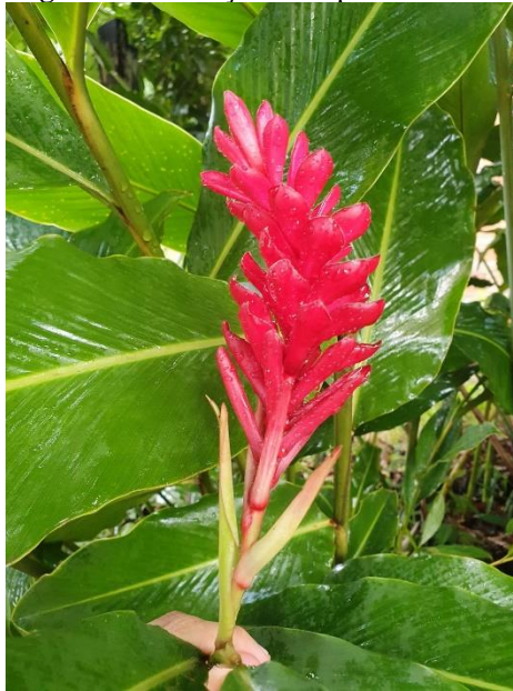
Figura 09 - Floração da Alpínia vermelha