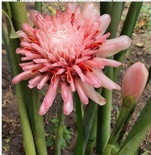
Figura 03 - Floração do Bastão-do-Imperador rosa